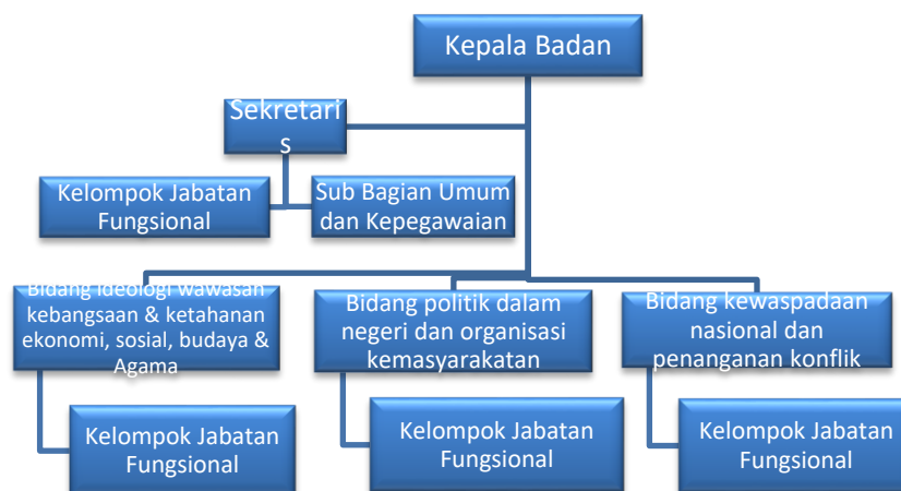
Gambar 2. 1 Struktur Organisasi Badan Kesatuan Bangsa dan Politik Kabupaten Kepulauan Anambas

Lebih lanjut Struktur Organisasi Badan Kesatuan Bangsa dan Politik Kabupaten Kepulauan Anambas dapat dilihat pada gambar 1 dibawah ini.